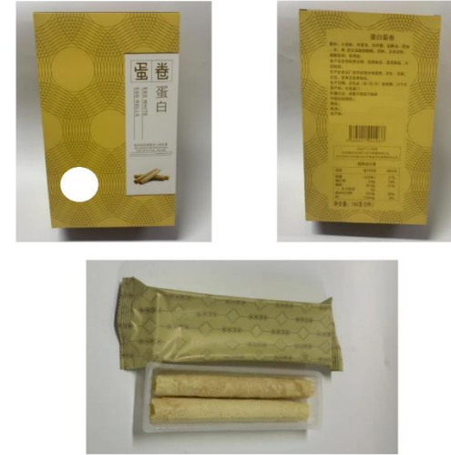
標籤圖片 (標籤系列用相同成份列表，並另外以電子形式提交標籤圖片。)