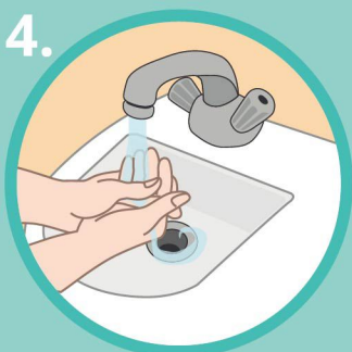
清洗雙手 Passar as mãos por água