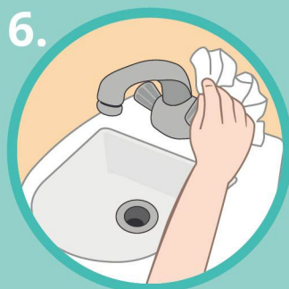
節約用水 Poupe água